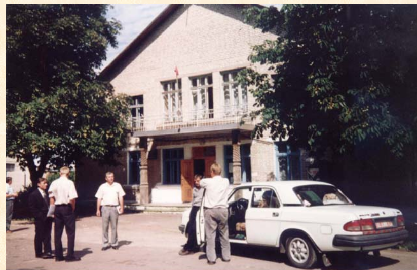
Municipio, biblioteca, casa della cultura