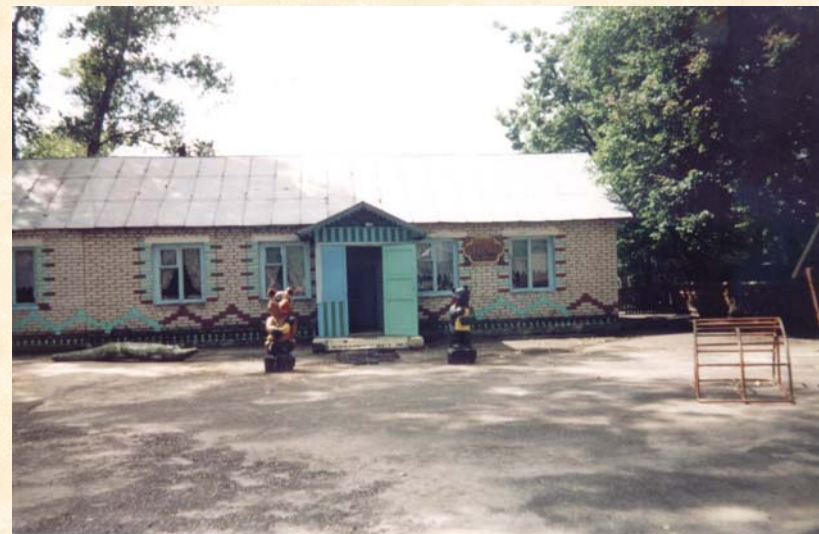
Il giardino d'infanzia